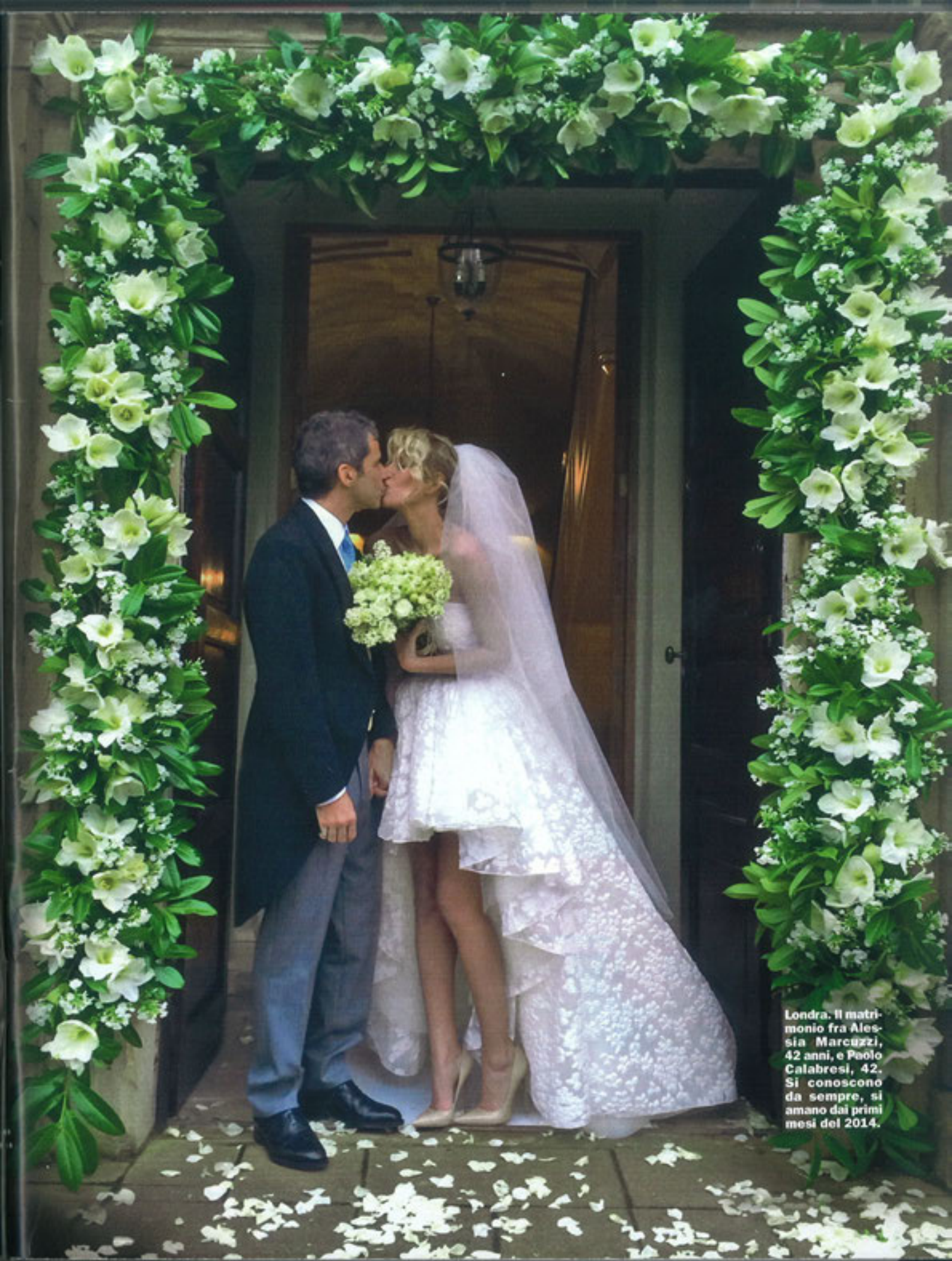
Londra. Il matrimonio fra Alessia Marcuzzi, 42 anni, e Paolo Calabresi, 42. Si conoscono da sempre, si amano dai primi mesi del 2014.